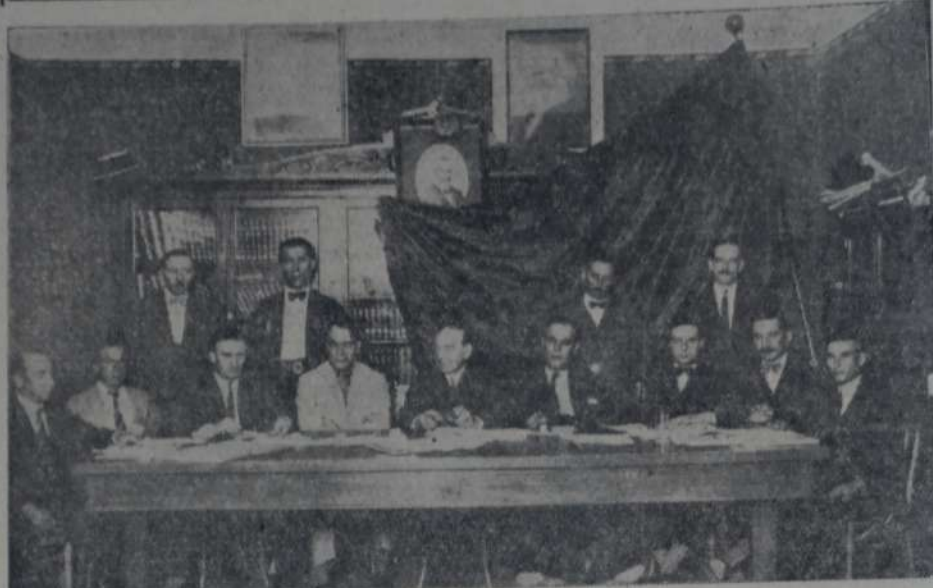
MESA DIRECTIVA DEL CONGRESO Y MIEMBROS DE LA FEDERACION SOCIALISTA MENDOCINA