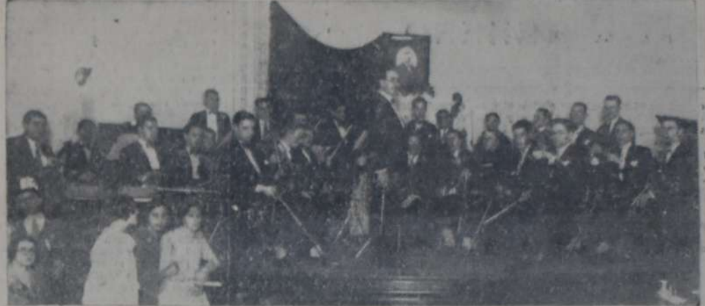
CONJUNTO DE LA ORQUESTA DE LA SOCIEDAD DE ARTE SINFONICO, DIRIGIDO POR EL MAESTRO Aaron Klasse, que actuó con todo éxito en el acto de anoche.

Escudándose luego en la enfermedad sensible de sus lectores. "El Pueblo" quiere sorprendernos lanzando la acusación de que los profesores "respaldándose en las bolillas del programa someten a las niñas en las pruebas finales a verdaderas torturas morales haciéndoles preguntas capciosas". Incierto, por supuesto, todo lo que antecede. En primer lugar el cuerpo de profesores de puericultura de las escuelas normales, Liceo de señoritas y escuelas profesionales está formado en su inmensa mayoría, por no decir en su totalidad, por médicos, hombres que, dadas su cultura científica y su dedicación a la carrera, no necesitan sin duda regocijarse en el vano placer de hacer preguntas capciosas a niñas menores de veinte años porque al de malas intenciones irían armados, el ejercicio de su profes-