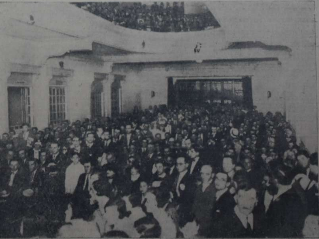
ASPECTO DE LA SALA DE LA CASA DEL PUEBLO DURANTE EL ACTO DE ANOCHE

"No era más humano — agregaba — ocuparse de evitar, en lo posible, tantos sufrimientos y tanta degradación. ¿Y como conseguirlo sin iluminar la mente del pueblo todo; sin instruirlo en la verdad científica, sin educarlo para más altas formas de convivencia social?" Y así Justo, en 1892, llegaba a la conclusión de que "la obra humana, la obra necesaria, se le presentaba como una infinda sbera de ideas; como un inmenso germinar de costumbres, que acabarían con el dolor estéril y diera a cada ser humano una vida digna de ser vivida". Y por eso agregaba: "Y pronto en-