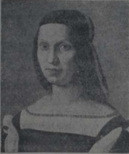
RODOLFO BIGORDI - GHIRLANDAJO "RETRATO DE MUJER"