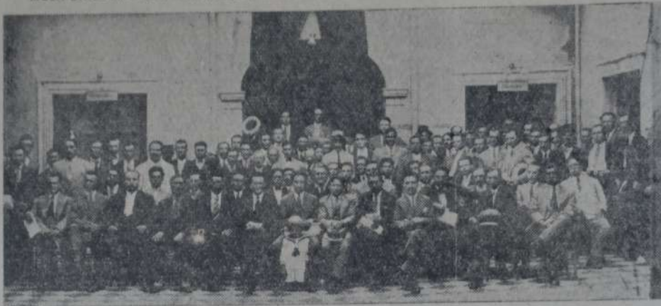
GRUPO DE DELEGADOS PRESENTES A UNA DE LAS REUNIONES DEL CONGRESO