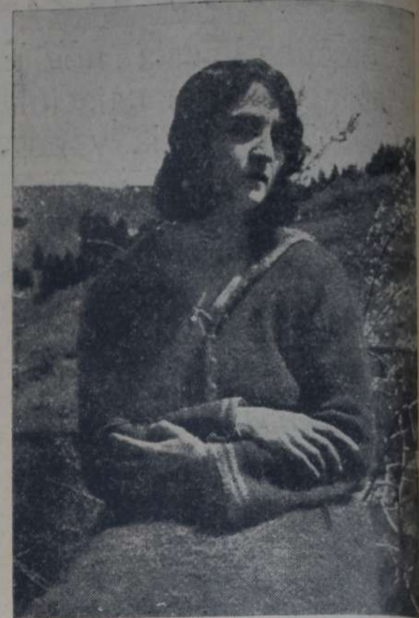
UNA HERMOSA CAMPE SINA DE FIEROLE